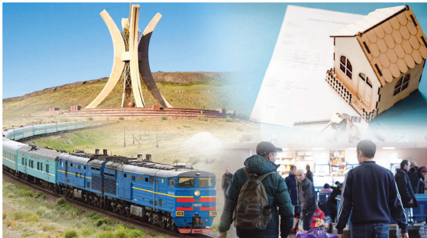
Елнәр КАБА (қолжазба)