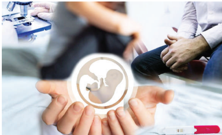
Елшір ҚАБА (қолжазба)

Елімізде бедеулік диагнозы қойылған 20 мың әйел мен 4 мың ер адам есепте тұр. Әрі мұндай азаматтардың саны жылдан-жылға көбеймесе, азаймай тұр. ДДСҰ-ның дерегіне, еліміз белсіздік пен бедеуліктің белең алуынан кейбір Еуропа елдері мен АҚШ-тың өзін басып озған.